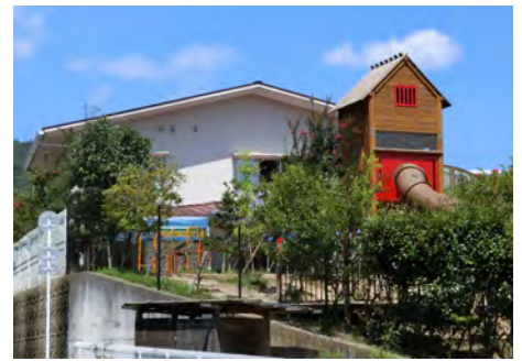
摂津峡認定こども園