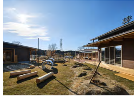
しまもと里山認定こども園