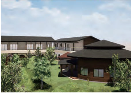
清水認定こども園