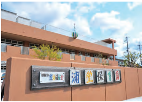
浦堂認定こども園