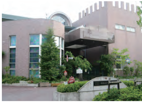
阿武山たつの子認定こども園